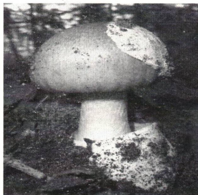
Grüner Knollenblätterpilz Amanita phalloides

Es werden Ihnen 9 Unterrichtseinheiten Klinische Fortbildung à 45 Minuten bestätigt.